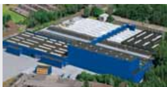
Hörmann KG Amshausen, Niemcy