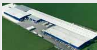
Hörmann LLC, Montgomery IL, USA