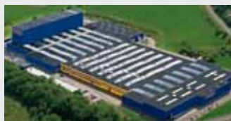
Hörmann KG Freisen, Niemcy