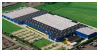
Hörmann KG Brandis, Niemcy