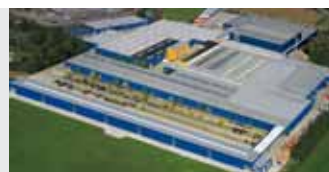
Hörmann KG Brockhagen, Niemcy