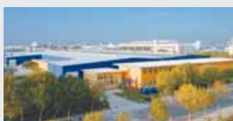
Hörmann Beijing, Chiny