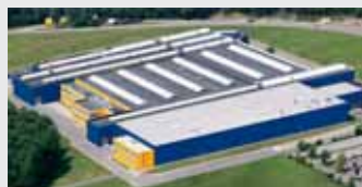
Hörmann KG Eckelhausen, Niemcy