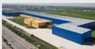
Hörmann Tianjin, Chiny