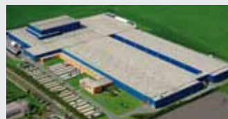
Hörmann KG Ichtshausen, Niemcy