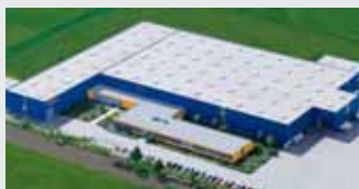
Hörmann KG Dissen, Niemcy