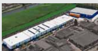
Hörmann Alkmaar B.V., Holandia