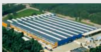
Hörmann Genk NV, Belgia