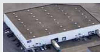
Hörmann Flexon, Leetsdale PA, USA

Grupa Hörmann oferuje wszystkie elementy stolarki budowlanej z jednej ręki – jako jedyny producent na międzynarodowym rynku. Produkowane są one w wysoko wyspecjalizowanych zakładach, zgodnie z najnowszymi osiągnięciami techniki. Rozbudowana sieć dystrybucji i serwisu w Europie oraz obecność firmy w Ameryce i Chinach sprawia, że Hörmann jest solidnym partnerem w zakresie stolarki budowlanej, której jakość nie dopuszcza żadnych kompromisów.