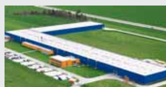
Hörmann Legnica Sp. z o.o., Polska