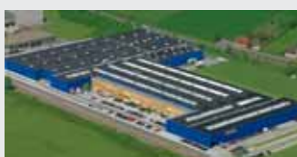
Hörmann KG Werne, Niemcy