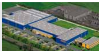
Hörmann KG Antriebstechnik, Niemcy